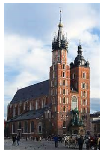
Mariakyrkan i Krakow