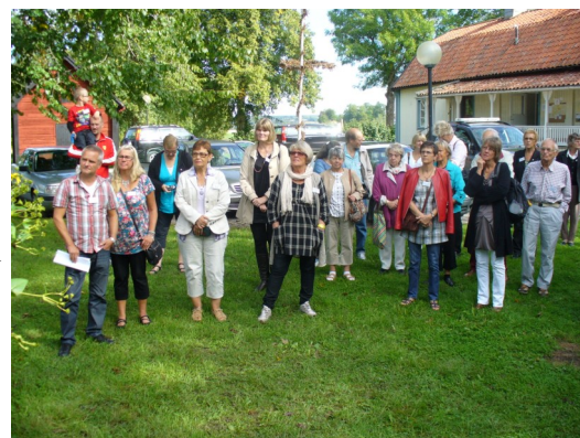
Samling utanför Bishop hill Muséet