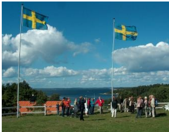
Deltagarna samlade framför Socityshuset på Utö

Vi var ett 50-tal släktingar som hade samlats denna dag och